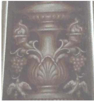
Decorazione su alcune colonne Duomo S. Pietro - Schio

Vite e vino: la vite, nella Bibbia, è simbolo di benessere, fecondità, benedizione; ad essa è collegato anche il vino, simbolo di gioia, di festa nuziale, di alleanza. In Oriente era simbolo di benessere fino da identificare la vita umana con una foglia di vite.