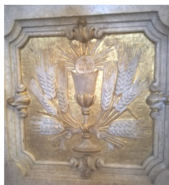
Altare Santissimo, Duomo S. Pietro-Schio